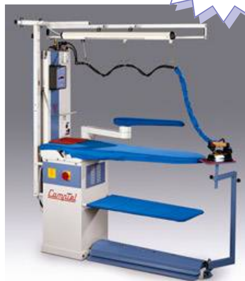
Table présentée avec options

Modèle pour travail pointe à droite pointe à gauche. Deux formes de plateau : Classique, Forme spéciale pantalon et jupes. Fonction simultanée de la vapeur du fer et de l'aspiration.