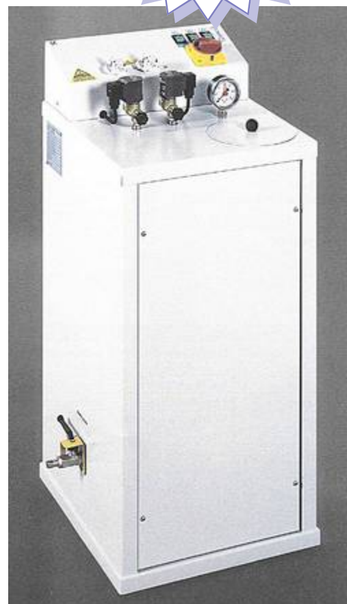
Chaudière livrée avec 4 roulettes